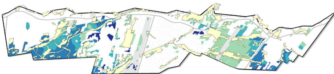
Priorité de conservation

This prioritization is illustrated on figure 2 in order to guide the town's choices in terms of the natural areas' conservation.